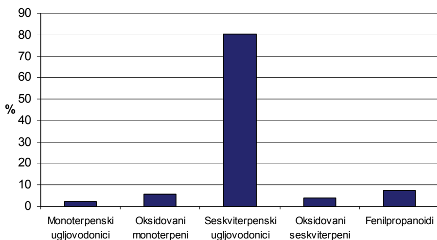
Slika 1. Grupe hemijskih jedinjenja u etarskom ulju Ocimum sanctum L.

a Eksperimentalno određen Kovačev indeks; b Kovačev indeks dat literaturnim podacima; c relativno retenciono vreme (FID) odgovarajuće komponente u odnosu na odabranu referentnu (zajedničku) komponentu; d koncentracioni indeks